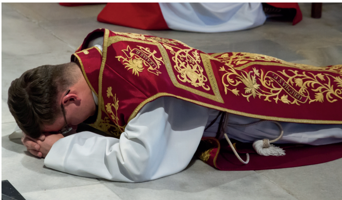
Karfreitagliturgie mit niederwerfen vor dem Volksaltar