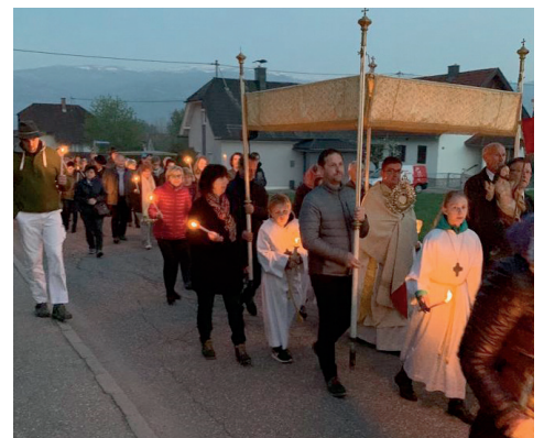
Osternachtfeier 4 Uhr früh in St. Johann