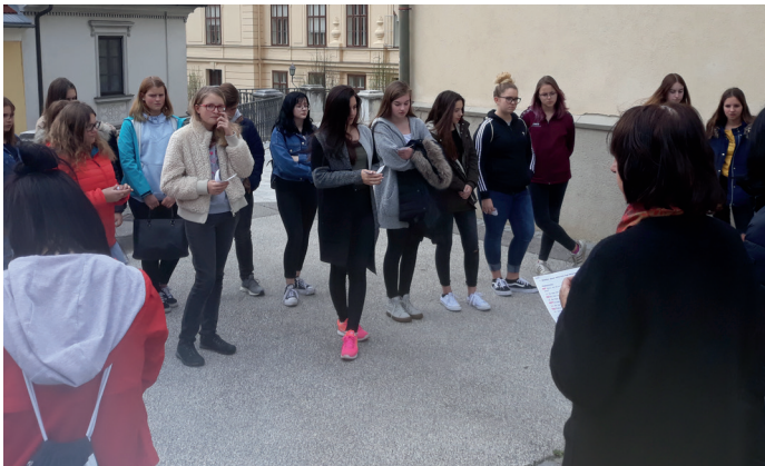
Jugendkreuzweg mit Firmlingen