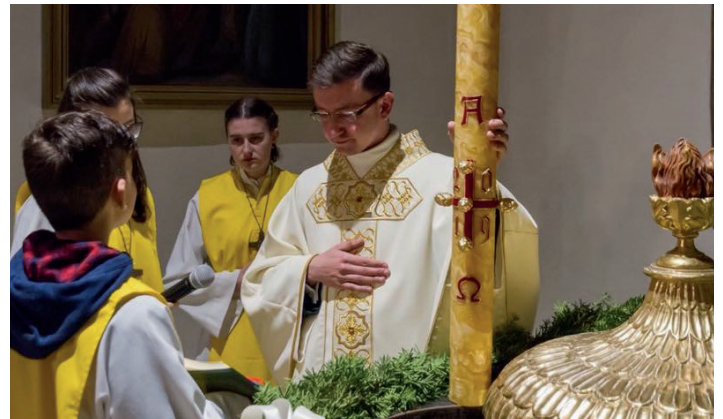
Osternacht in der Markuskirche