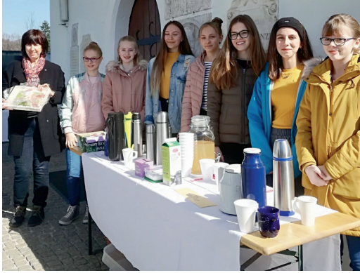
Pfarrkaffee in St. Johann – Firmlinge sammelten für den Familienfasttag