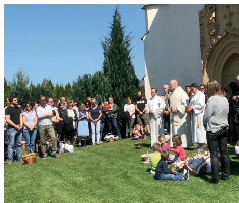
Speisensegnung in St. Thomas