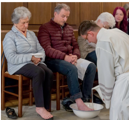
Abendmahliturgie mit Fußwaschung