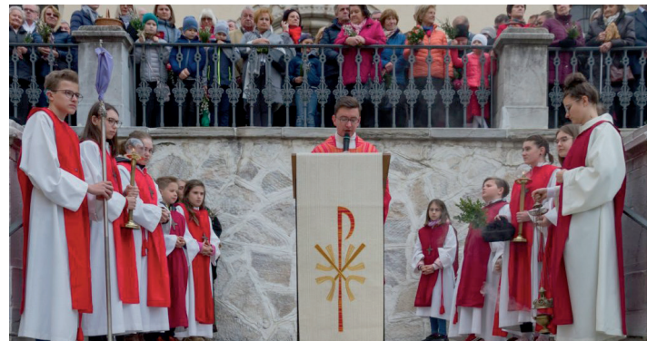
Palmweihe am Schulplatz der Musikschule Wolfsberg mit anschl. Messe in der Markuskirche