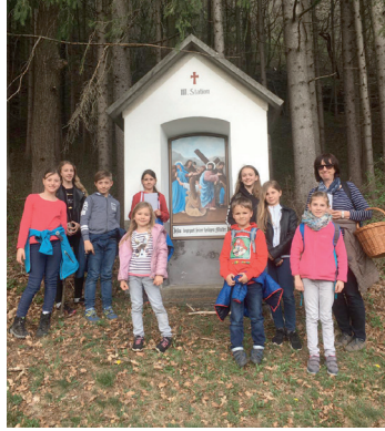
Ausflug der St. Johanner Ministranten zum St. Pauler Kreuzweg