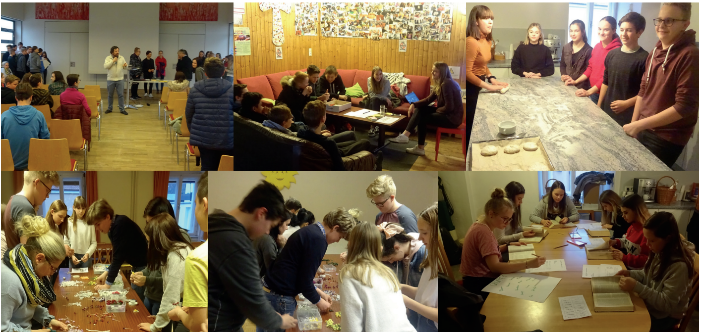
Firm-Event der Firmlinge mit tollem Programm, wie Bibelquiz, Bibelbrot backen, Firmanstecker, Lichterweg in der Markuskirche