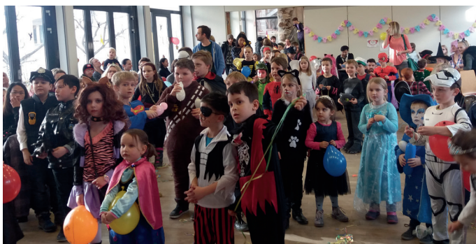
Kinderfasching im Markussaal – Kinder können so fröhlich sein, sie lieben Spaß und Spiel.