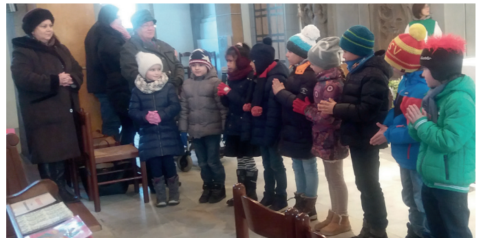
„ Gott hat dich bei deinem Namen gerufen “ – die Erstkommunionkinder der Volksschule Wolfsberg beim Vorstellungsgottesdienst.