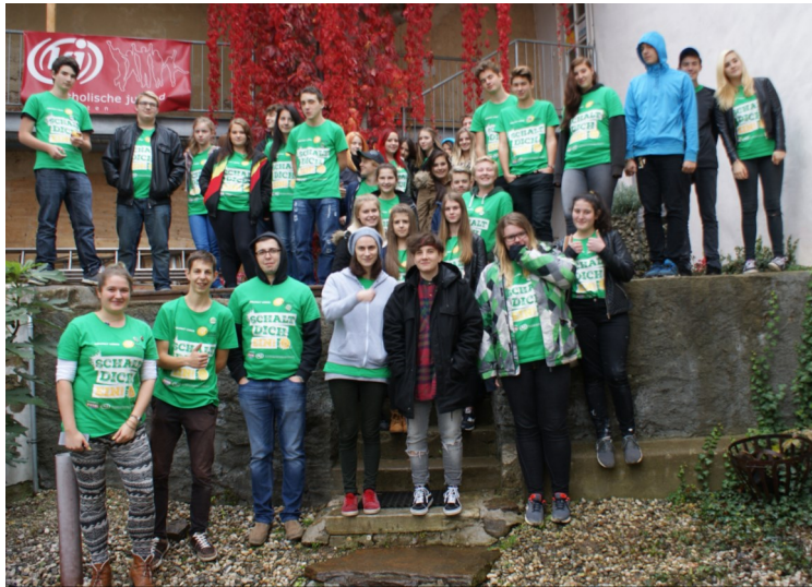
72h ohne Kompromiss - Gruppenfoto 2016

„Vielfalt leben - schalt dich ein!“ - unter diesem Motto fand von 19. - 22. Oktober 2016 bereits zum 8. Mal das Sozialprojekt „72 Stunden ohne Kompromiss“ statt. Die „72h“ werden alle zwei Jahre von der Katholischen Jugend Österreich, in Zusammenarbeit mit der youngCaritas und Hitradiö Ö3 organisiert. Mit österreichweit circa 5000 TeilnehmerInnen sind die „72h“ die größte Jugend-Sozialaktion Österreichs. Im Lavanttal engagierten sich heuer 41 Jugendliche in fünf Projekten.