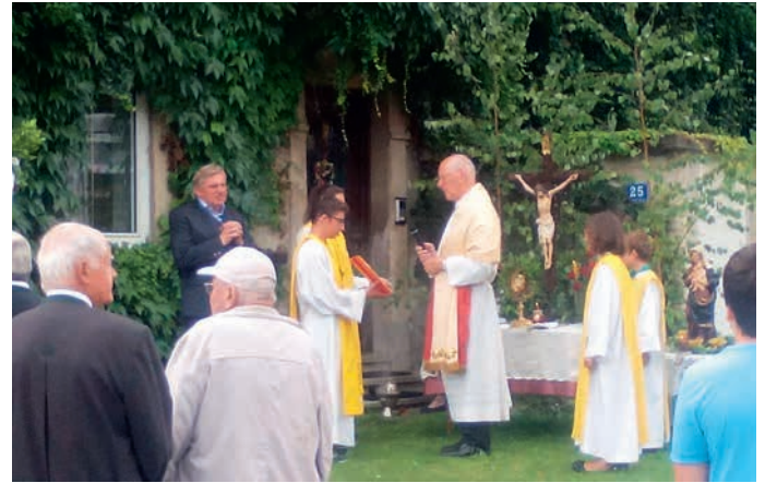
Kirchweihfeste in der Sommerzeit. Das Johannesfest in St. Johann und das Jakobifest in St. Jakob konnten wir bei gutem Wetter würdig feiern.