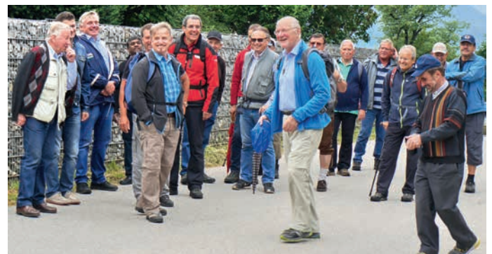
Bildtext: Mitte unten – Fußpilgern ist wieder in! Wir waren mit den Männern in Maria Saal, wir waren mit 35 Teilnehmern in drei Tagestappen nach Gurk unterwegs.

Bildtext: Mitte rechts oben – Fußwallfahrt Gurk!