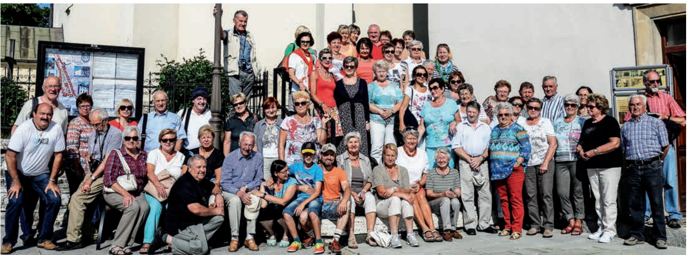
Ferienreise ins Zipserland – 60 begeisterte Pilger waren im Juli unterwegs, um die Ostslowakei mit ihren Naturschönheiten und ihren Kunstschätzen zu erkunden. Danke für schöne, unvergessliche Tage.