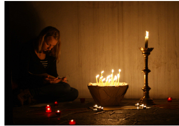
Kontaktwoche St. Andrä

Das Arbeitsjahr 2012/2013 war - vor allem zu Beginn - von einigen größeren Aktionen geprägt. Da war einerseits die Kontaktwoche in St. Andrä mit Schulbesuchen, SpiriCaching und einer „Nacht der 1000 Lichter“ im St. Andräer Dom. Von 17. - 20. Oktober setzten sich über 40 Jugendliche wieder „ 72h - ohne Kompromiss “ in sechs Projekten im Lavanttal ein. So ein Arbeitsjahr besteht aber nicht nur aus Großprojekten, sondern auch aus vielen kleineren Aktionen: Ob Kerzen für verlassene Verstorbene entzündet werden, der KJ-Nikolo alle Stationen des LKH besucht oder der Frühling gesucht wird - die Jugendlichen sind mit vollem Einsatz dabei! Im April und Mai waren wir bei den Firmungen in St. Lorenzen,