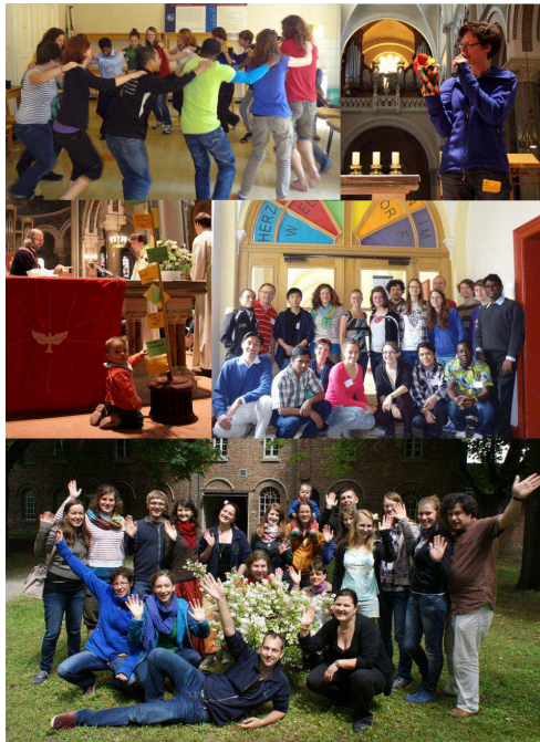
Pfingstfest in St. Gabriel

Bei den elf Workshops konnte man z.B. nach Herzenslust spielen, Missio-