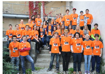
72h - ohne Kompromiss