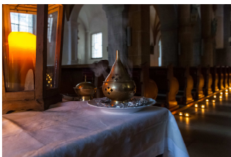
Lange Nacht der Kirchen