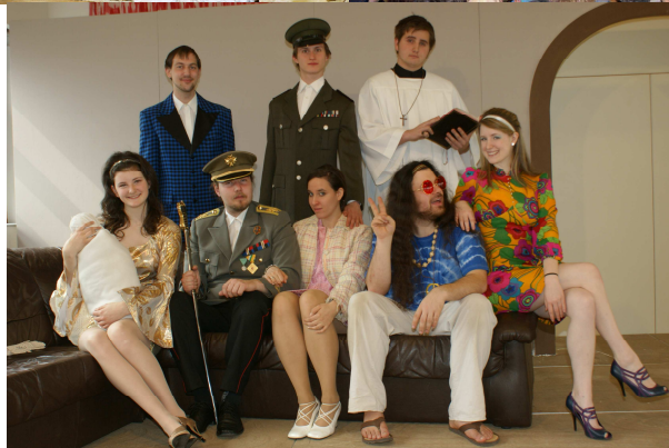
Obere Reihe von links: Pymalion (2004), Der eingebildete Kranke (2005), Einen Jux will er sich machen (2007), Man kann nie wissen (2008) Mitte: Halb auf dem Baum (2011)